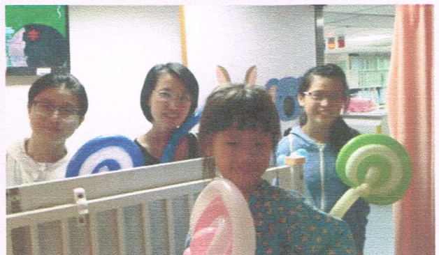
《魔法天使》醫院病童家庭關懷服務