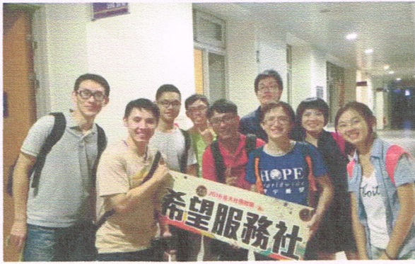
《兒少課輔》台大志工老師招募