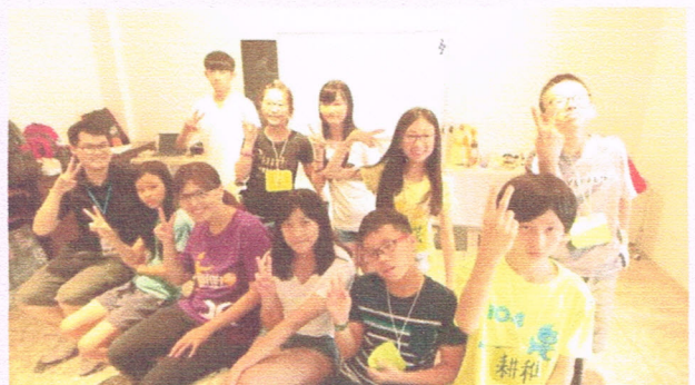
「暑數一夏育樂營」團康遊戲