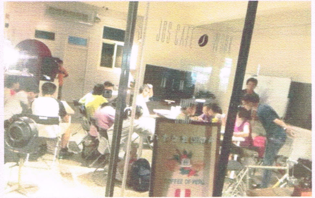
《兒少課輔》週一夜間陪讀服務