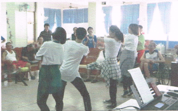
《愛滋關懷》病友探訪熱舞表演