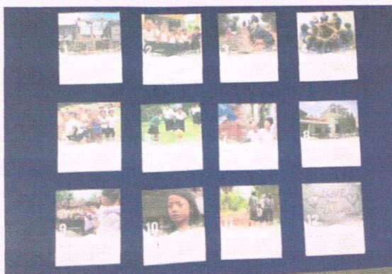
「愛寨一起」柬埔寨蓋屋建廁紀念桌曆