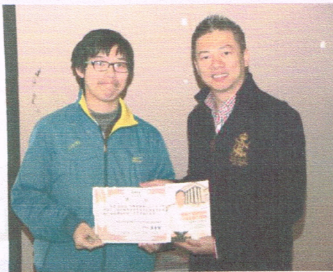
《希望獎學金》頒獎活動及主題演講