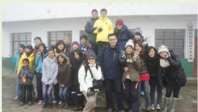
【希望小學】2012 志工團員合照