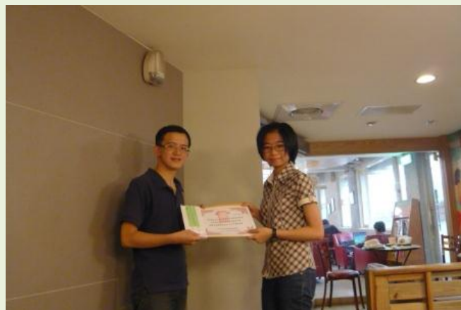
【希望獎學金】第 19 屆頒獎照片