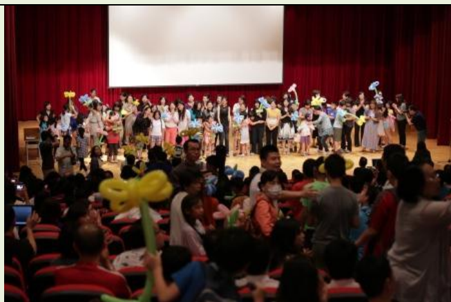
【魔法天使】母親節氣球折花獻愛