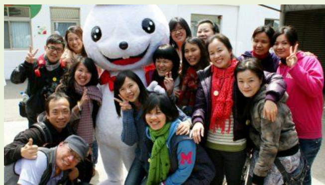
【魔法天使】志工培訓交流—氣球博物館參訪