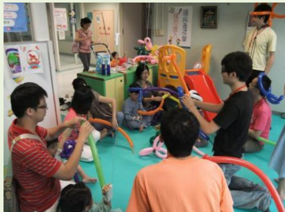
【魔法天使】台北馬偕氣球故事屋活動